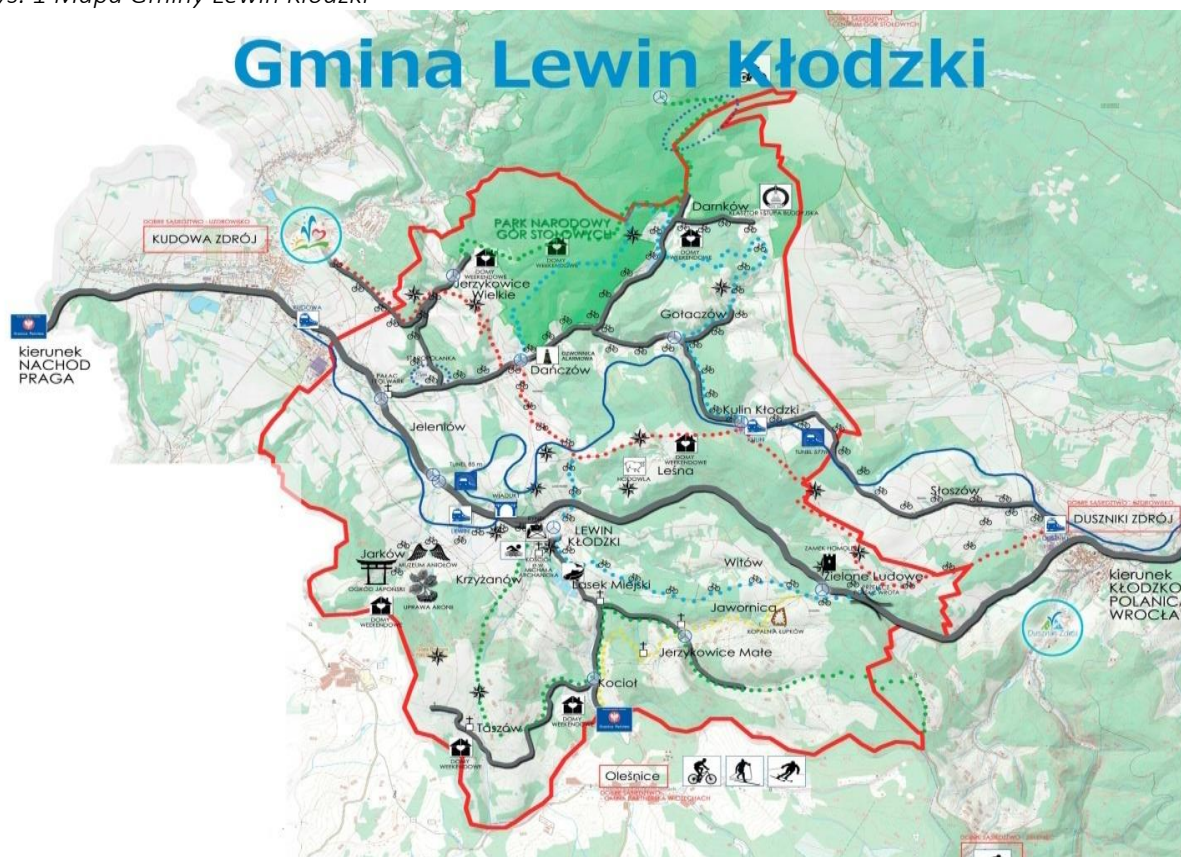
Rys. 1 Mapa Gminy Lewin Kłodzki

Obszar gminy należy do terenów górskich, gdzie wyraźnie zaakcentowana jest rzeźba dolinna, otoczona niezbyt wysokimi grzbiecami wzniesień, które pokryte są przez lasy i łąki. Powierzchnia gminy wynosi 5 214 ha, przy czym 46% powierzchni przypada na użytki rolne, a 48% na grunty leśne oraz zadrzewione i zakrzewione. Część powierzchni gminy (745 ha) stanowi obszar prawnie chroniony. Największy udział tejże powierzchni przypada na tereny parków narodowych (81%) oraz obszary chronionego krajobrazu (19%).