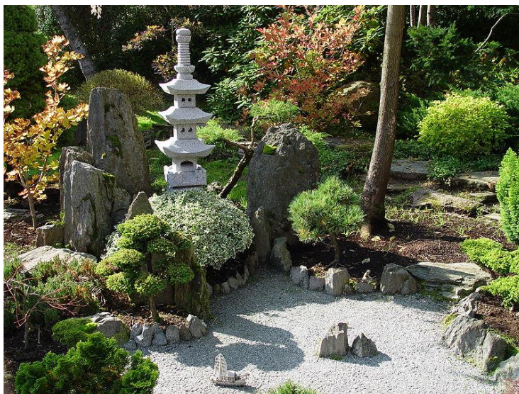
Fot. 4 Ogród japoński w Jarkowie