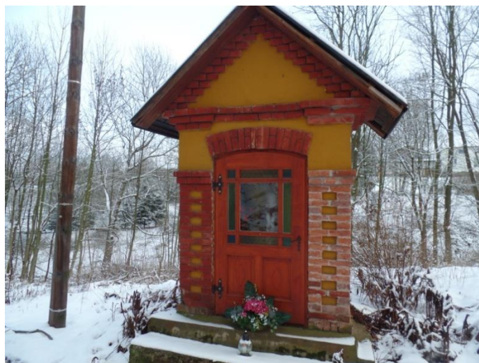
Fot. 2 Kapliczka domkowa w Jarkowie