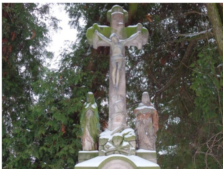
Fot. 3 Krzyż przy drodze do domu nr 7 w Jarkowie

Przy głównej drodze naprzeciwko domu nr 8 stoi kamienny krucyfiks z drugiej połowy XIX w. z metalową figurą ukrzyżowanego Jezusa. Natomiast przy drodze do domu nr 7 usytuowany jest neobarokowy kamienny krzyż z 1897 roku. Po obu jego stronach umieszczono odlewane figury Matki Boskiej i św. Jana, a cała kompozycja opiera się na zestawieniu prowadzącego do śmierci grzechu pierworodnego człowieka (pień opleciony przez węża, ustawiony na kopcu kamieni ozdobionych motywem czaszki) z aktem zbawienia (scena Ukrzyżowania).