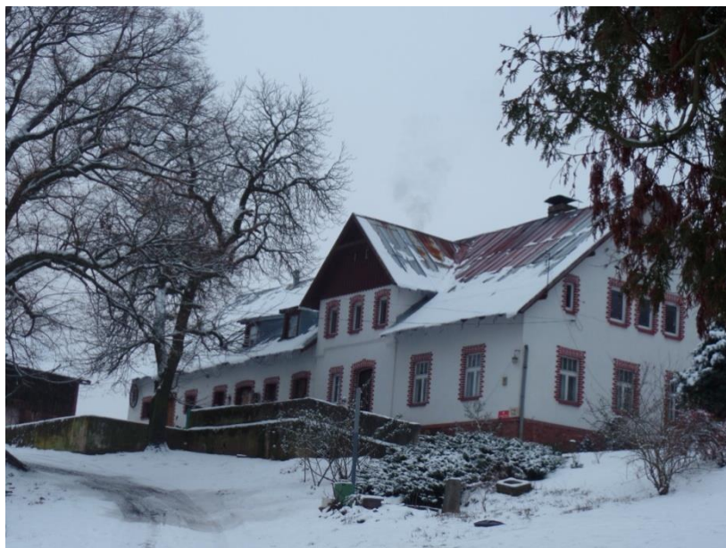
Fot. 1 Dom nr 7 w Jarkowie

z charakterystyczną otynkowaną elewacją ożywioną obramowaniami okiennymi wykonanymi z cegły. Czwarty z domów (nr 13) uzyskał swój obecny kształt w 1910 r., a reprezentuje budownictwo związane z turystyką. Wystrój elewacji nawiązuje do secesji.